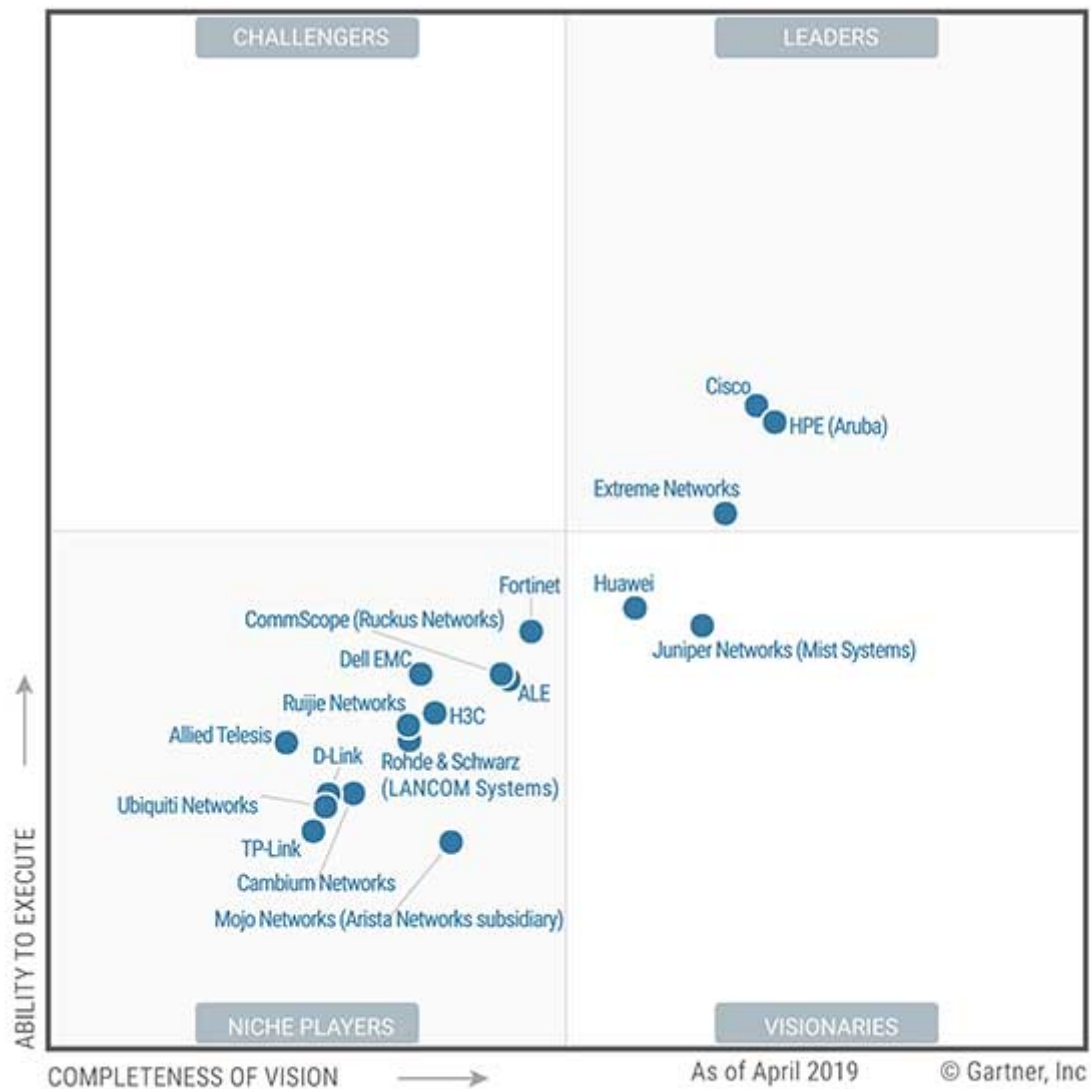
Figure 1. Magic Quadrant for the Wired and Wireless LAN Access Infrastructure

Líderes de vendas no mercado de wifi (Gartner Magic Quadrant 2019)